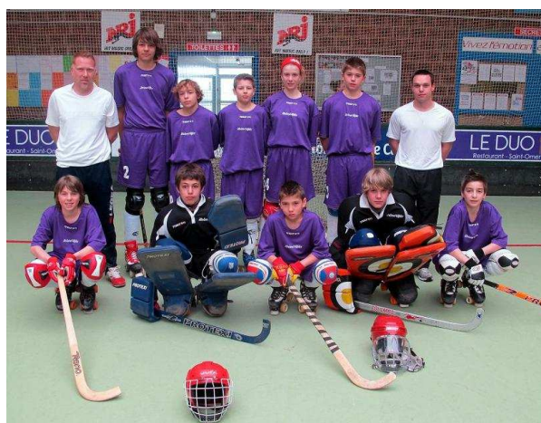
Sélection à St Omer