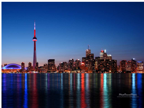
Ville de Toronto

A midi les élèves amènent leurs « lunch box », la nourriture n'est pas très équilibrée, beaucoup de pizzas, chips....etc