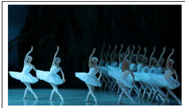
le lac des cygnes