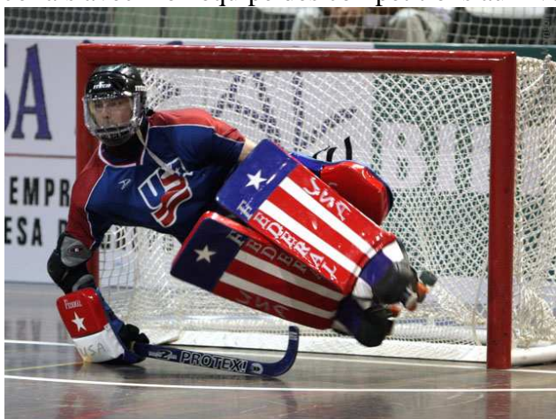
Un gardien en position

Je fais avec mon équipe des compétitions au niveau de la région Rhône-Alpes